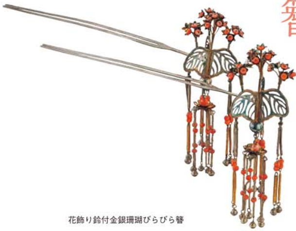
花飾り鈴付金銀珊瑚びらびら簪

「お洒落」とはやはり「着飾る」とことでしょか。「着」で連想するのは衣装ですが、「飾」の文字には髪飾り、ひいては髪の意味があります。髪のかき方のモデルチェンジが進んだ江戸時代、女性は身分制社会のなかで制約を受けながらも美を求めました。支配階層であっても貴金属を身にまとう習俗が普及しなかった当時、装飾品は手にのるような櫛、簪、筥に集約されました。職人が技術の粋を凝らした多様な髪飾りは、女性の立場や年齢によって異なる髪型を美しく引き立てます。