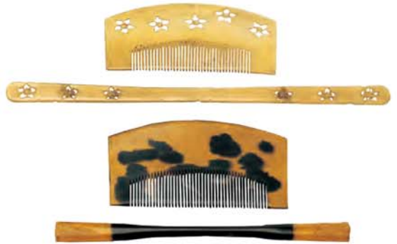
松竹梅鶴詩絵櫛・筥 龍甲桜透かし櫛・筥 龍甲櫛・筥