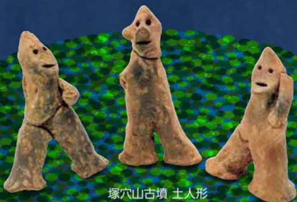
塚穴山古墳 土人形