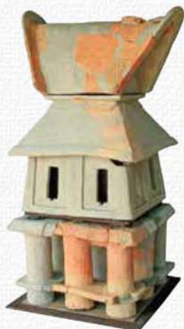
小墓古墳 家形埴輪