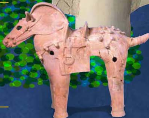
ツルクビ1号墳 馬形埴輪