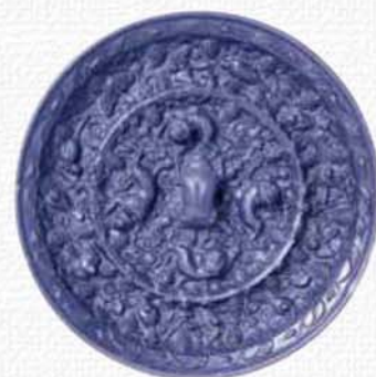
杣之内火葬墓 海獣葡萄鏡

天理市の市街地には、日本最大の前方後方墳である西山古墳や、西乗鞍古墳・塚穴山古墳など古代豪族物部氏の首長墓と考えられる大型古墳が残っており、杣之内(そまのうち)古墳群と呼ばれています。また明治時代以降の記録によると、杣之内周辺にはもっと多くの古墳があったことがわかります。さらに近年の発掘調査によって、群集墳もみついています。