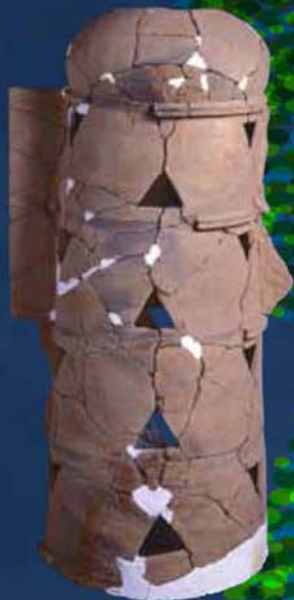
西山古墳外堤 朝顔形埴輪