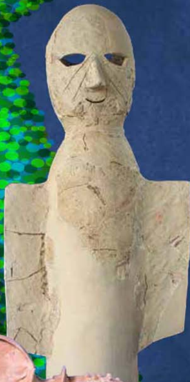
小墓古墳 盾持人物埴輪