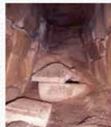
東乗鞍古墳石室 と石棺