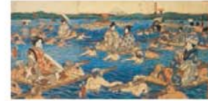
"Rio Oi ao longo da estrada Tokaido" Autor: Kunihisa 1857 Larg. 89,5 cm