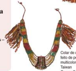
Colar de chefe de aldeia feito de pedras de vidro multicolorido Taiwan Compr. 74,9cm