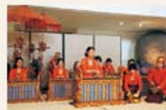
Aula prática de gamelão