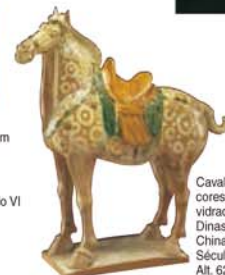
Cavalo de três cores em cerâmica vidrada Dinastia Tang, China Século VIII Alt. 62,1 cm