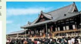
Sede da Igreja Tenrikyo