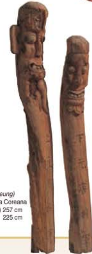
Totem (chang-seung) Península Coreana Alt. (esq.) 257 cm (dir.) 225 cm