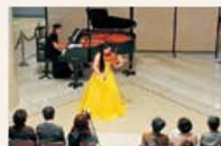
Concerto no Museu, "Sankokan Melodieux"