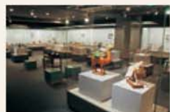
Galerias de exposições especiais no 3º andar