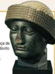
Estátua da cabeça de Gudea feita de diorito Iraqe Século XXII a.C. Alt. 25,1 cm