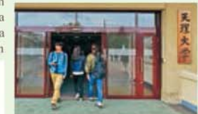
Campus da Universidade Tenri