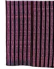
Saia (pozahuanco) México Compr. 154,9 cm