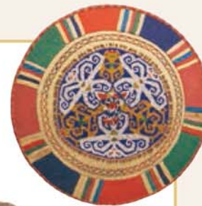
Chapéu feito de missangas (saong) Bornéu Diâm. 56 cm