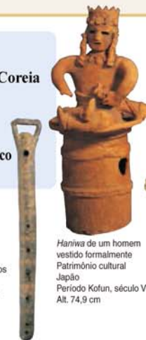
Haniwa de um homem vestido formalmente Patrimônio cultural Japão Período Kofun, século VI Alt. 74,9 cm