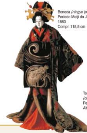
Boneca (ningyo joruri) Período Meiji do Japão 1883 Compr. 115,5 cm