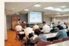
Sala de aula no subsolo