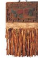
Letreiro de loja (huang-zi) "Loja de macarrão" China Compr. 79 cm