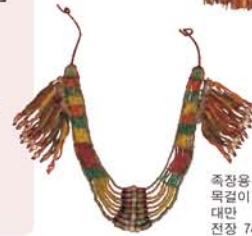
죽장용 잠자리구슬 목걸이 대만 전장 74.9cm