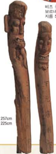
정승 한반도 높이 왼쪽 257cm 오른쪽 225cm