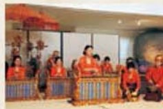
워크샵 가믈란(Gamelan) 체험 강좌