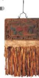
간판 「우동 가게」 중국 전장 79cm