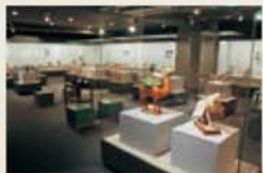
3층 기획 전시실