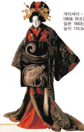
게이세이·아코야 (精城 阿古屋) 일본 1883년 높이 115.5cm