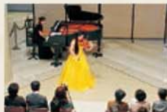
뮤지엄 콘서트 참고관 멜로디뮤 (Sankokan Melodieux)