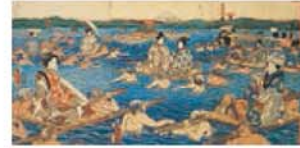
도카이도 가와즈쿠시 오오이가와와 그림 (東海道川畫大井川圖) (목판화 3장) 일본 1857년 우타가와와테이 구니히사 (歌川亭國久) 가로 89.5cm