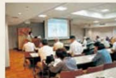
지하 1층 연수실