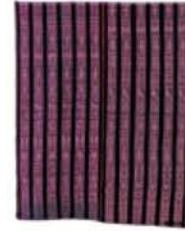
치마 (포사왕코) 멕시코 길이 154.9cm