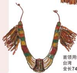
首领头蜻蜓玉项链 台湾 全长74.9厘米