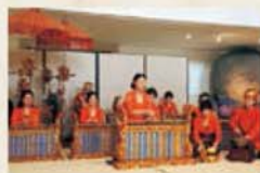
研习会 甘美兰体验讲座