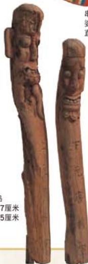
长生标 朝鲜半岛 高 左257厘米 右225厘米