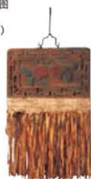
招牌 (幌子)“切面店” 中国 全长79厘米