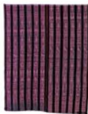
裙装 (pozahuanco) 墨西哥 长154.9厘米