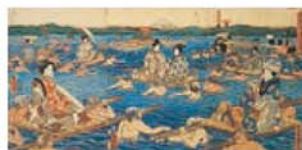
东海道川尽大井川图 〔锦绘 3 连图〕 安政4年（1857年） 歌川亭国久画 宽89.5厘米