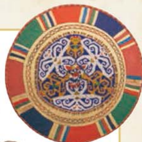
串珠装饰的斗笠 婆罗洲 直径56厘米