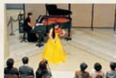
博物馆音乐会 参考馆 Melodieux