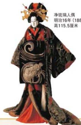
净琉璃人偶 明治16年(1883年) 高115.5厘米