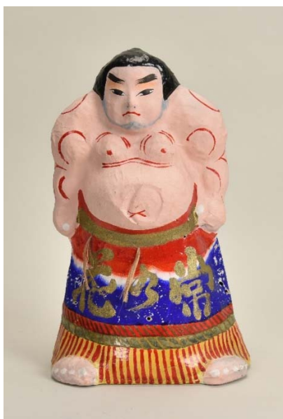
うどはりこりきし 宇土張子 力士

いまからおよそ 1300年前、奈良時代の天平六年七月七日に聖武天皇が日本中から力持ちを集めてすもうをとらせました。これを「相撲節会」といいます。「節会」とは季節のかわりめに天皇がひらく会です。天皇はなぜ七夕の日にすもうをとらせただでしょうか。