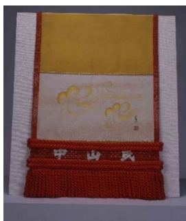
よこづなでるくにけしやう つゆはらいやう 横綱照國化粧まわしのうち 露払い用

力士のトップは横綱です。横綱が「露払い」の力士と「太刀持ち」の力士をしたがえて「土俵入り」をおこないます。むかしから建物をたてるときに、地下にひそむ悪いものをふみつけておさえる地固め式をおこないました。この地固め式に出て「しこ」をふむのが横綱です。横綱は特別な力をもつスーパーマンとかんがえられていたからです。鞠を蹴りあう蹴鞠では、プレイする鞠場のすみに木を植えます。鞠がその木にあたると、たまった露が落ちてぬれることがありました。身分の高い人をぬらしてはいけないということで、はじめに鞠をわざと木にあてて露を落としておきます。このことから、えらい人より先に進んで悪いものをとりのぞくことを「露払い」というようになりました。化粧まわしは、本場所用のまわし「取りまわし」の前だれが、取り組み中にじゃまになることから、土俵入りだけに使うまわしとして生まれました。江戸時代に大名が自分の力士にテラックスな「取りまわし」をあたえ、取り組みにくくなったことから区別されるようになりました。