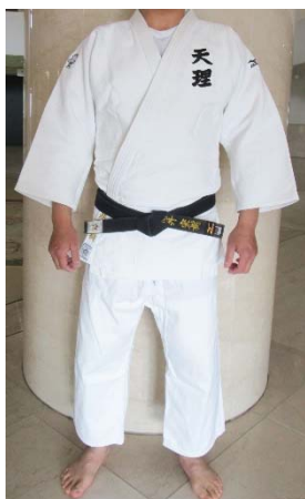
じゅうどうぎ ぞう 柔道着 (個人蔵)

わたしたちが「柔道」とよぶのは 1882年に嘉納治五郎によってはじめられたもので す。もとのかたちは武士の技「組みうち」です。武士の戦い方は、敵とはなれた弓矢 の戦いにはじまり、そのあと近づいて槍や刀をつかいます。槍や刀が折れたら、 素手で敵を組み伏せるしかありません。これが「組みうち」で、この技が組み合わさつ て「柔術」となりました。嘉納は「柔術」のあぶない技をなくし、心身をきたえる方法 としてととのえたのです。武士は戦場に出るとき、鎧の下に白い着物を身につけま す。それは死ぬ気で戦場に行くという気もちをあらわすものです。また、白はけがれ のない清らかさをしめします。どんな色にもそまります。それはすべてを受け入れるス ケールの大きさをあらわすものでもあります。1997年には審判(どちらが勝ったか) をつけやすいという意見から、世界でカラー柔道着がみとめられるようになりました。