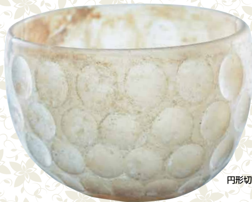
円形切子ガラス碗