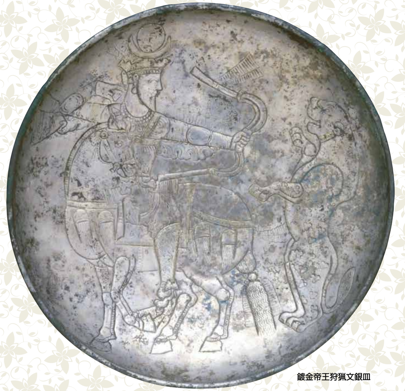
鍍金帝王狩獅文銀皿