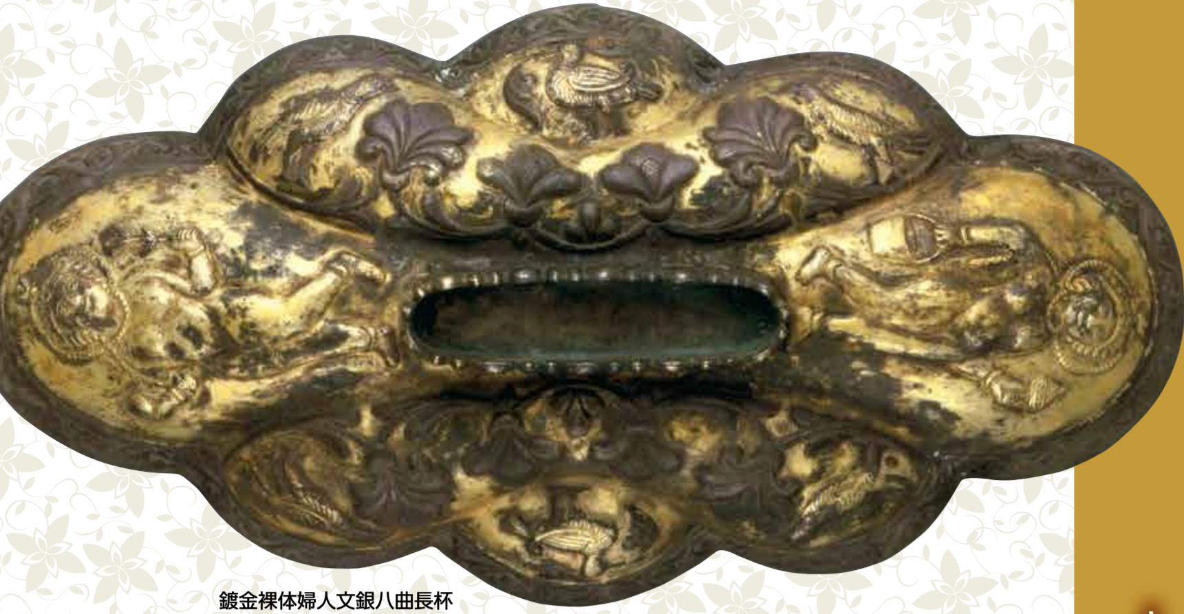
鍍金裸体婦人文銀八曲長杯