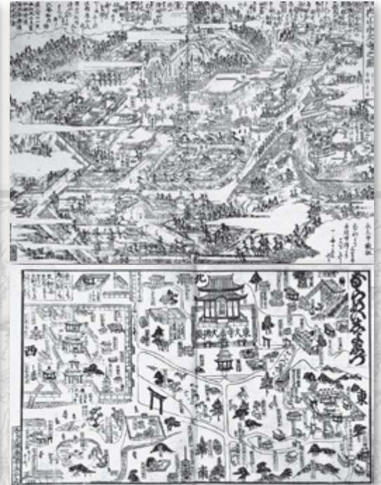
上) 小刀屋善助引札、右上) 内山永久寺之図、右中) ならめいしよゑづ、右下) 吉野山細見絵図