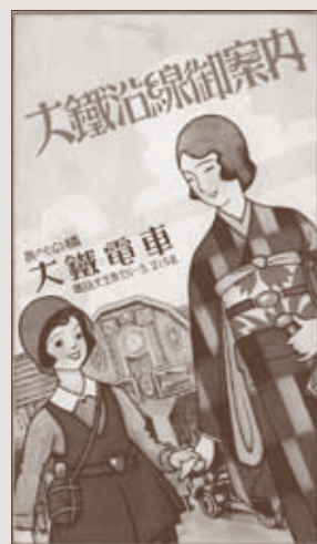
大鉄沿線御案内/昭和8年