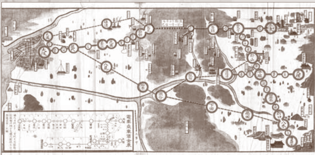
大軌電車案内/大正11年