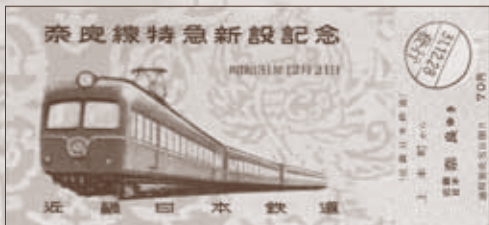
近鉄 奈良線特急新設記念乗車券/昭和31年