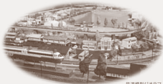
鉄道模型ジオラマ (平成24年)

近鉄の切符を製作していた印刷機の実演と企画展示室に設置したジオラマに鉄道模型を走らせます。