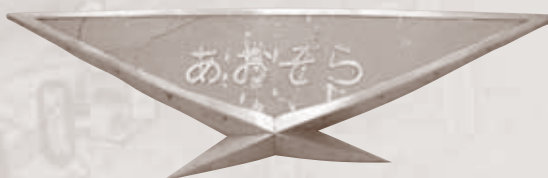
近鉄 20100系電車「あおぞら号」ヘッドマーク/昭和37~平成元年