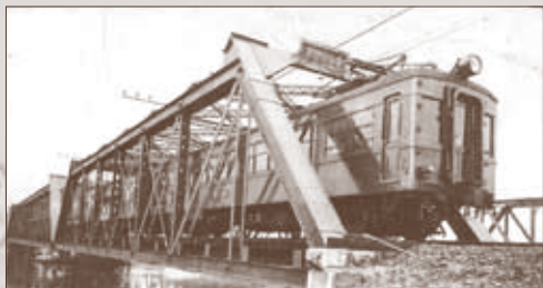
関急電 尾張大橋絵葉書

本展では、乗車券や関連する紙資料を中心に、大私鉄の歴史をひもとくとき、地域住民の足としてはもちろん、広範囲のネットワークとして果たしてきた役割について紹介します。