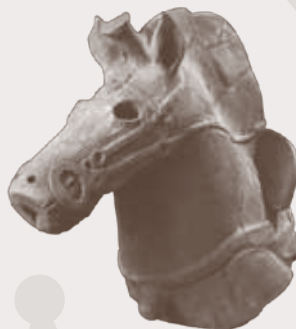
馬形埴輪 (出土地不詳)