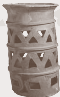
円筒埴輪 (奈良県出土)

今回の展覧会では、天理参考館が所蔵する埴輪から約70点を厳選し、大小いろいろな埴輪をご覧頂きます。埴輪が語る歴史に触れて頂くとともに、埴輪の造形美をお楽しみ頂けることと思います。