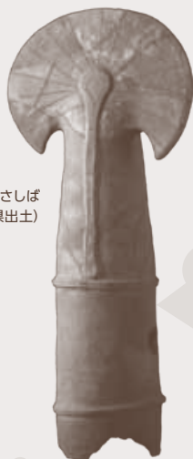
器財埴輪 さしば (茨城県出土)