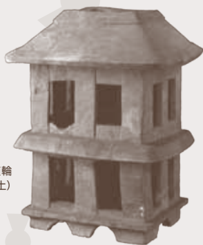
家形埴輪 (兵庫県出土)