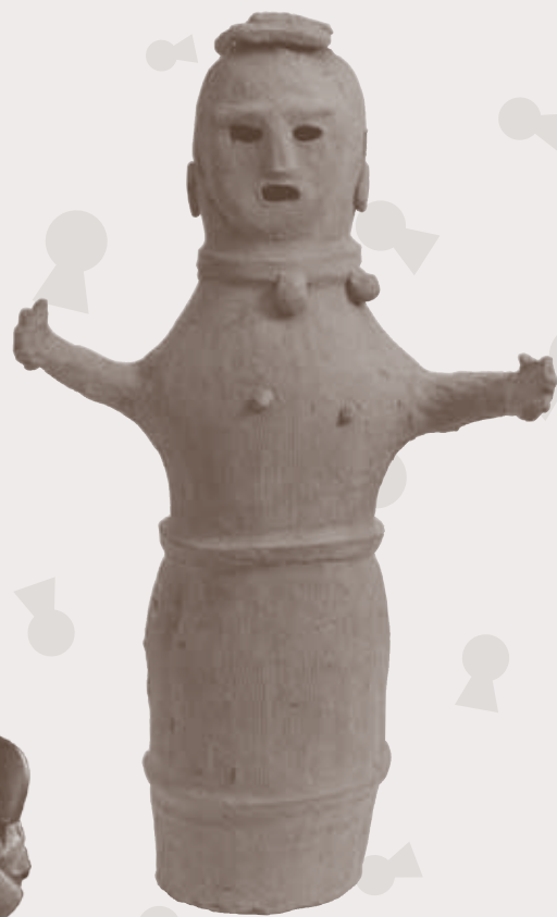
人物埴輪 女性 (出土地不詳)