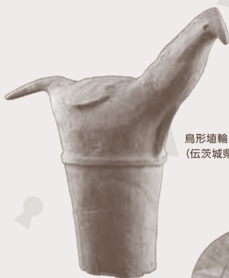
鳥形埴輪 (伝茨城県出土)